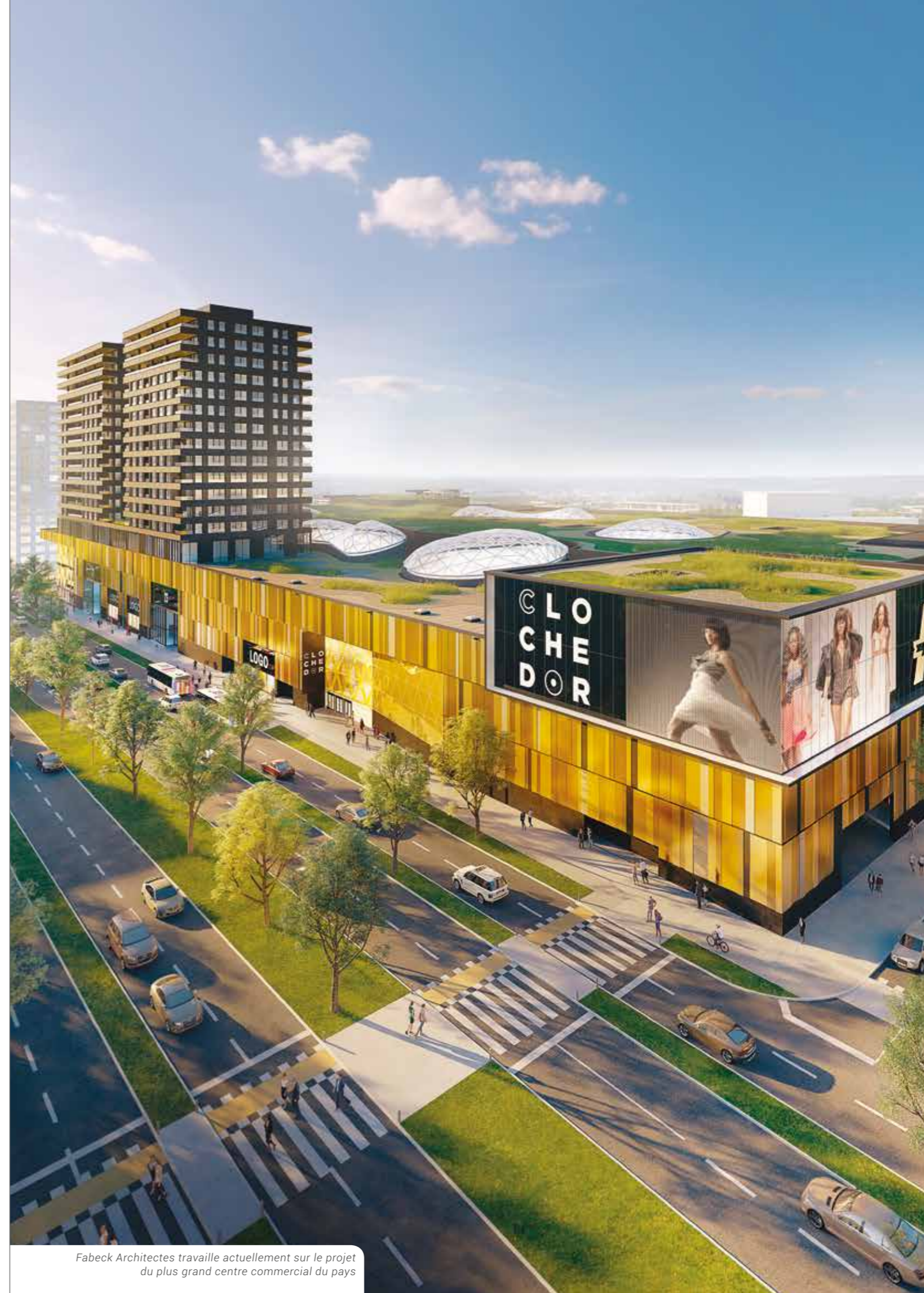
Fabeck Architectes travaille actuellement sur le projet du plus grand centre commercial du pays

En revanche, elle souligne tout de même un bémol : « nous devons nous battre pour réaliser les exécutions, car de plus en plus de missions s'arrêtent à la phase du permis de bâtir. C'est regrettable car le métier d'architecte va plus loin que cette étape, celle de la construction est également importante ».