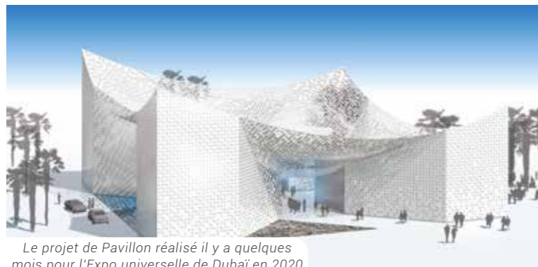
Le projet de Pavillon réalisé il y a quelques mois pour l'Expo universelle de Dubaï en 2020