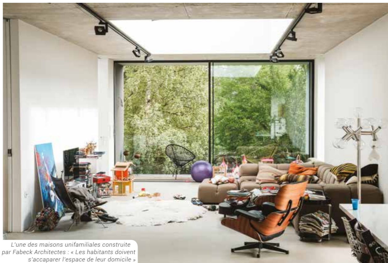
L'une des maisons unifamiliales construite par Fabeck Architectes : « Les habitants doivent s'accaparer l'espace de leur domicile »

Egalement remporté via ce mode de sélection, le projet du Royal Grace, situé en bordure du Boulevard Royal : « nous avons été très rationnel au niveau de l'implantation de l'escalier et de l'ascenseur, ça a plaidé en notre faveur. La parcelle étant minuscule, il fallait optimiser chaque mètre carré ». Résultat, un immeuble de bureaux de 1.575m 2 , dont la façade est synonyme d'arborescence, en référence au parc situé à proximité : « elle est composée de parties métalliques qui sont plus larges en bas, et qui deviennent de plus en plus étroites en montant » explique Tatiana Fabeck.